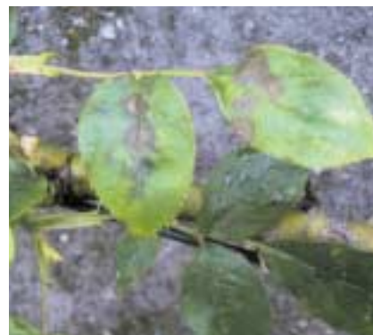
Taches noires du rosier