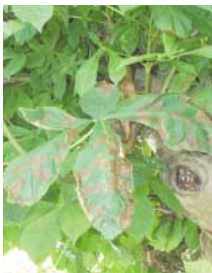
Black rot du marronnier

Remarque : une certaine action frénatrice du mancozèbe sur les acariens a été remarquée.