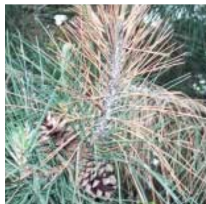
Brunissure des pousses de conifères.